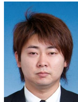
※赤アフロ委員長&副委員長

途中あまりの人の多さにソフトクリームの機械が悲鳴を上げるといったハプニングもありましたが、たくさんのフロアメンバーの協力があったからこそ成功だったのではないかと思います。ご協力いただき誠にありがとうございました。また、ブース出展に多大なるご協力をいただいた浅野味噌(株)様においても大変感謝をしております。ありがとうございました。